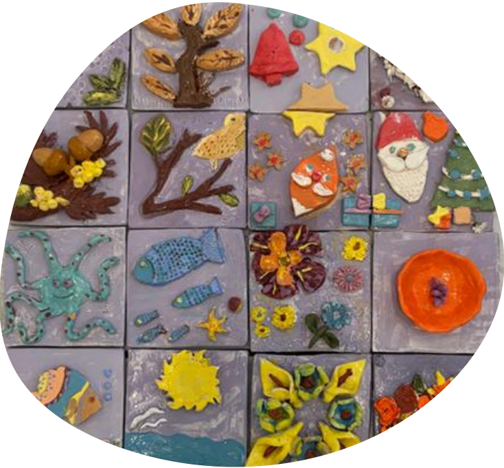
Intergenerational Art Workshops