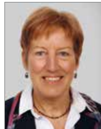
Prof. Dr. Ursula Lehr, Dipl.-Psych. BAGSO-Vorsitzende