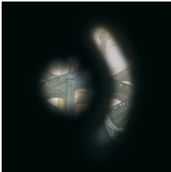
Blick in ein Treppenhaus ohne Sehbehinderung (links) und mit fortgeschrittenem Glaukom (rechts)