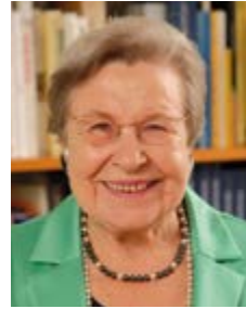
Prof. Dr. Dr. h.c. Ursula Lehr

R obert Lembke brachte es einst auf den Punkt: „Alt werden ist natürlich kein reines Vergnügen. Aber denken wir an die einzige Alternative.“ Das Alter bringt ganz unterschiedliche Veränderungen mit sich, die uns immer wieder von Neuem herausfordern. Mit einer davon setzt sich diese Broschüre auseinander: das Nachlassen der Sehkraft. Doch auch wenn die Augen schwächer werden, schwinden noch lange nicht alle Fähigkeiten, die Sie im Laufe eines langen Lebens erworben haben. Ein selbstbestimmtes Leben, die Teilhabe an der Gesellschaft – lassen Sie sich das nicht nehmen. Auf den folgenden Seiten finden Sie viele Informationen, die Ihnen dabei helfen.“