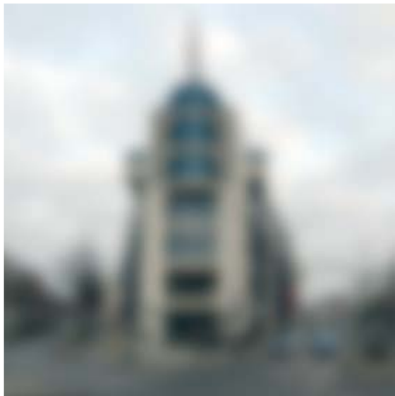
Blick auf eine Kreuzung ohne Sehbehinderung (links) und Seheindruck mit Grauem Star (rechts)