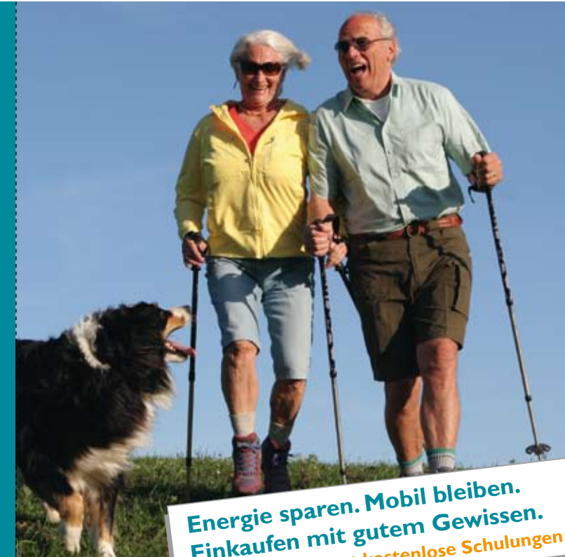
Stand der Information: Februar 2010

Energie sparen. Mobil bleiben. Einkaufen mit gutem Gewissen. Die BAGSO bietet kostenlose Schulungen