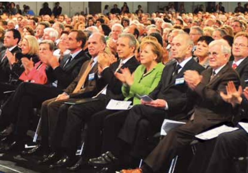
Eröffnungsveranstaltung zum 9. Deutschen Seniorentag in Leipzig mit Bundeskanzlerin Angela Merkel.

Schirmherr des 10. Deutschen Seniorentages ist Bundespräsident Christian Wulff.