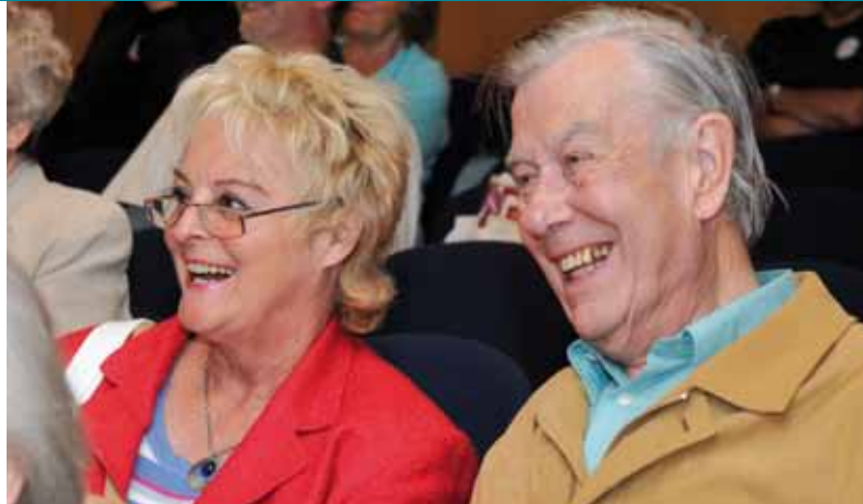
Informationen, Unterhaltung, Begegnung: Beim Deutschen Seniorentag ist für jeden etwas dabei.

Unter dem Motto „ JA zum Alter! “ soll von der Veranstaltung die Botschaft ausgehen: Wir nehmen das Älterwerden und das Altsein in seiner Vielfältigkeit an, mit seinen Potenzialen und Herausforderungen, aber auch mit seinen Grenzen.