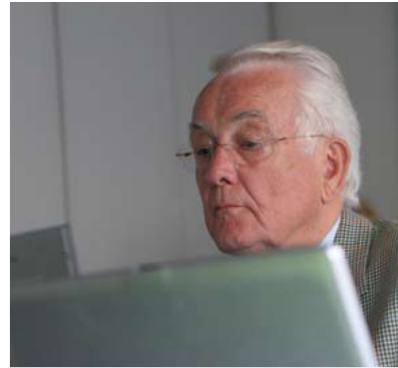
Internet-Workshop auf dem 8. Deutschen Seniorentag

Auf diese Weise möchten wir den Mehrwert des Internets aufzeigen und mit Hilfe von Multiplikatoren aus der Seniorenarbeit dem Einzelnen vermitteln. Internetschulungen sind und bleiben wichtig, doch sie sind bereits der zweite Schritt. Unsere Maßnahmen setzen an, bevor sich die älteren Nonliner mit der Internetnutzung